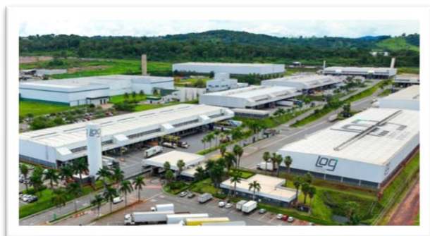
LOG Goiânia I

Esta é a terceira transação realizada no ano, somando R$ 764,5 milhões compreendendo 211.848 m 2 de ABL, em linha com a expectativa de venda anual da Companhia. Estas vendas realizadas refletem a atratividade e liquidez dos ativos da Companhia. A LOG segue demonstrando sua capacidade de desenvolvimento de projetos greenfield com expressivo retorno e geração de valor para os acionistas.