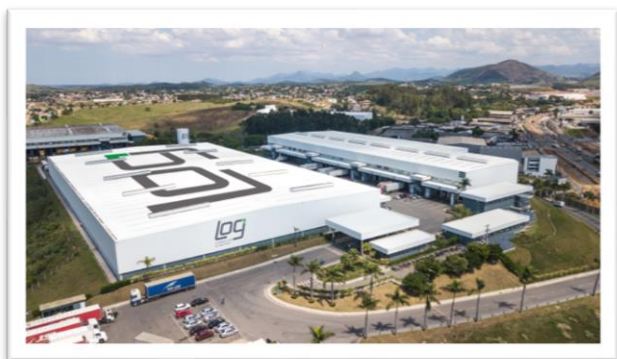
LOG Viana I

Com esta Transação, a Companhia já acumulou um valor significativo de R$ 629.445.644,93 (seiscentos e vinte e nove milhões, quatrocentos e quarenta e cinco mil, seiscentos e quarenta e quatro reais e noventa e três centavos) de vendas em 2024. Estas vendas realizadas refletem a atratividade e liquidez dos ativos da Companhia. A LOG segue demonstrando sua capacidade de desenvolvimento de projetos greenfield com expressivo retorno e geração de valor para os acionistas, por meio do reforço de caixa para novos investimentos.