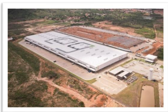
LOG Fortaleza III

A Companhia manterá seus acionistas e o mercado em geral atualizados sobre as etapas subsequentes relacionadas à Transação.