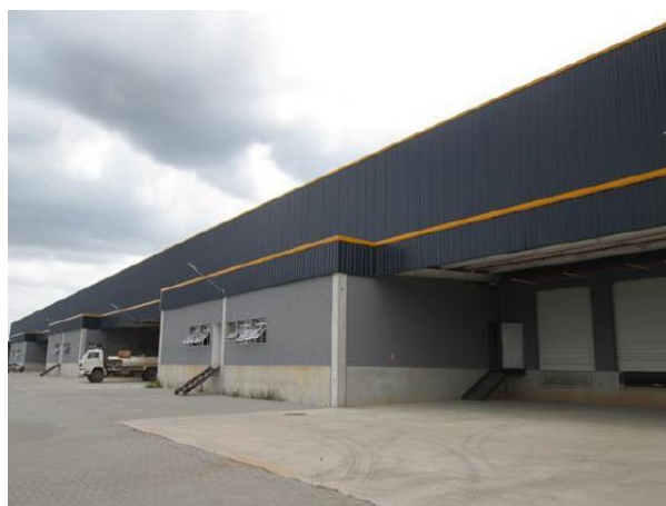
Edificação 1 – Galpão (Fachada)