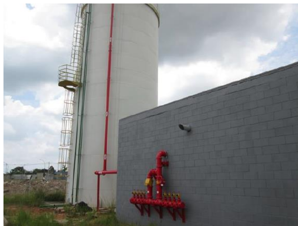
Reservatório e Casa de Bombas