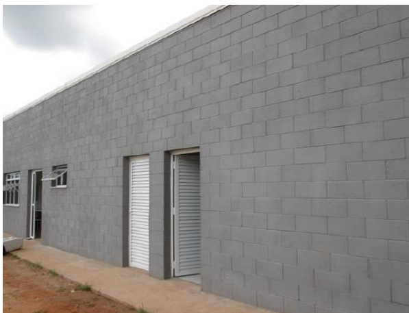
Edificação 2 – Refeitório (Fachada)