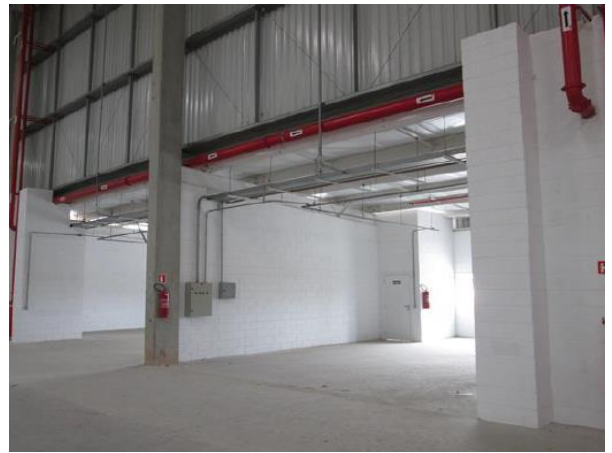
Edificação 1 – Galpão (Área interna)