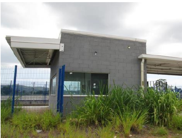
Edificação 3 – Portaria (Fachada)