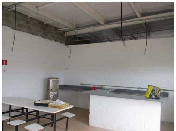
Edificação 2 – Refeitório (Área interna)