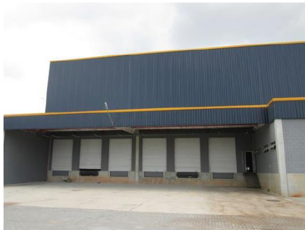
Edificação 1 – Galpão (Docas)