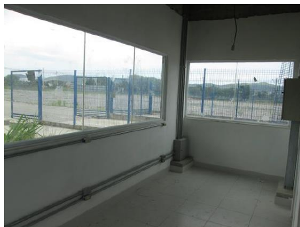
Edificação 3 – Portaria (Área interna)