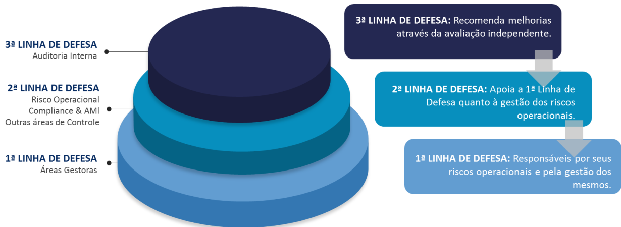
Figura 1: Representação Gráfica das Linhas de Defesa