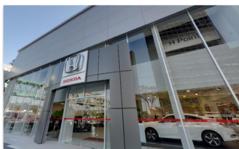
H POINT HONDA - Pinheiros

Desde a fundação da concessionária Ford Sonnervig há 96 anos , a Best Points tornou-se uma das mais tradicionais redes de concessionárias de veículos leves do município de São Paulo, ampliando sua operação para as marcas Honda e Renault .