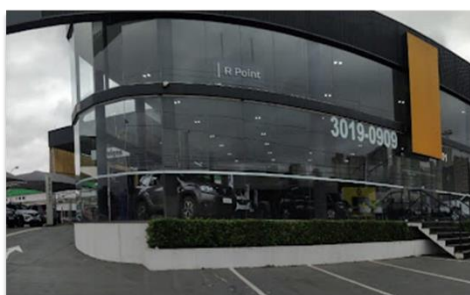
R POINT RENAULT - Ipiranga