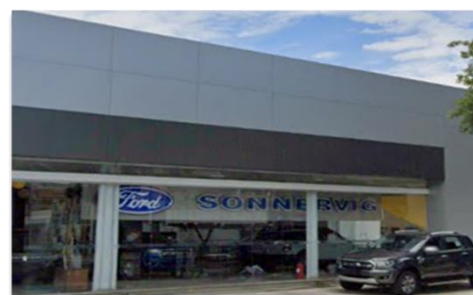
SONNERVIG FORD - Vila Guilherme

No 2T23 UDM, a Best Points teve os seguintes números não auditados: R$ 585 milhões de Receita Bruta, R$ 25 milhões de EBITDA, Lucro Líquido de R$ 15 milhões. Adicionalmente, a empresa vendeu 2.236 veículos novos e 1.939 seminovos neste período.