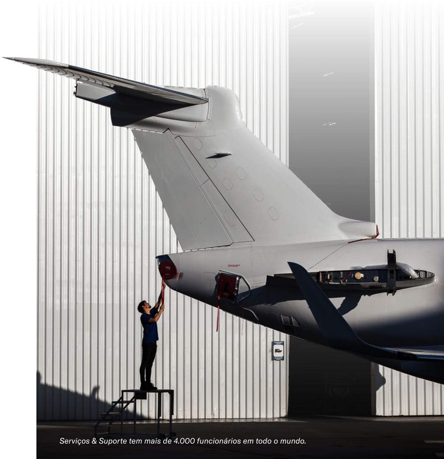
Serviços & Suporte tem mais de 4.000 funcionários em todo o mundo.

A unidade de Serviços & Suporte continua a ser um dos principais drivers do crescimento da Embraer por meio de uma combinação de excelência operacional, experiência do cliente e soluções inovadoras. A carteira de pedidos da Embraer Serviços & Suporte encerrou o período em US$ 3,1 bilhões no 1T24, valor estável em relação ao trimestre anterior.