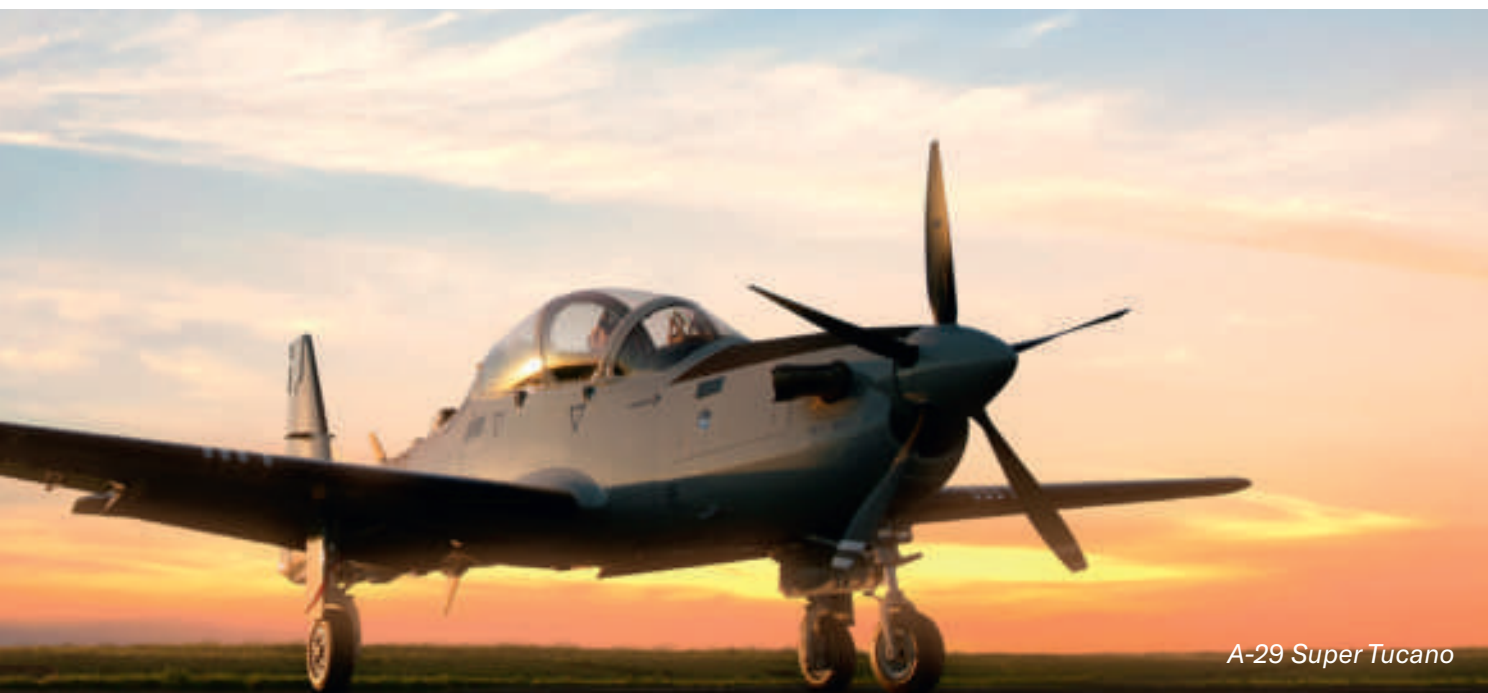
A-29 Super Tucano