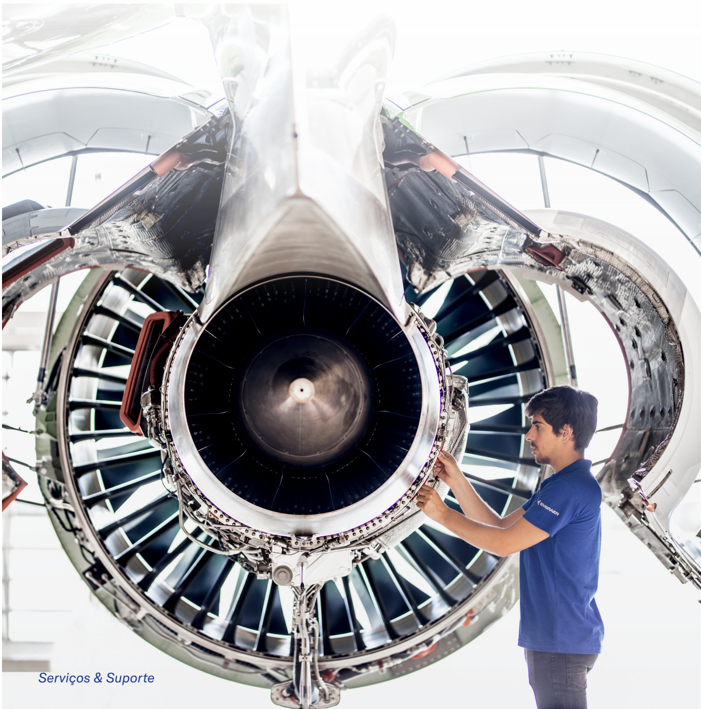
Serviços & Suporte

A unidade de Serviços & Suporte continua sendo um dos principais impulsionadores do crescimento da Embraer por meio da combinação de excelência operacional, experiência do cliente e soluções inovadoras. O backlog da unidade de negócios encerrou o 2T24 praticamente inalterado, em US$ 3,1 bilhões.