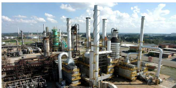
REPAR – Presidente Getúlio Vargas