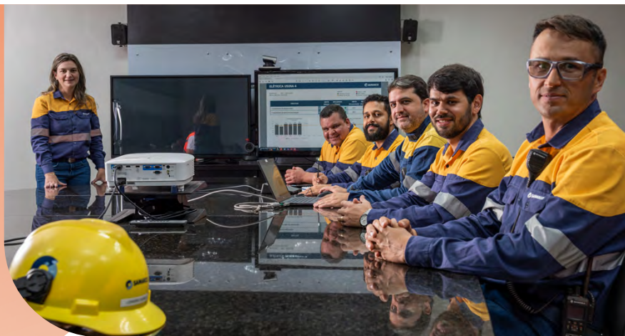
Empregada e empregados do Complexo de Ubu, em Anchieta (ES).