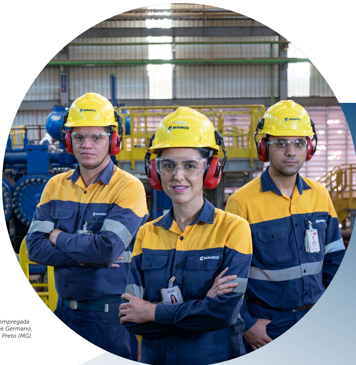
Empregados e empregada do Complexo de Germano, Mariana e Ouro Preto (MG).

no Prêmio Ibram Melhores Práticas na Mineração 2022, com o caso "Saúde Mental", e foi finalista em prêmio internacional da acionista BHP, sendo contemplada com um reconhecimento durante o HSEC Awards - premiação que reconhece iniciativas de saúde, segurança, meio ambiente, comunidade e sustentabilidade da BHP e suas joint ventures . Entre 340 projetos do mundo todo, o nosso Programa de Saúde Mental ficou entre os cinco de destaque em Saúde.