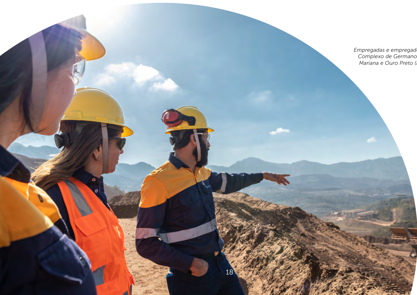
Empregadas e empregado do Complexo de Germano, em Mariana e Ouro Preto (MG).