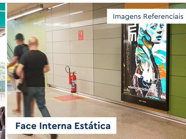
Face Interna Estática