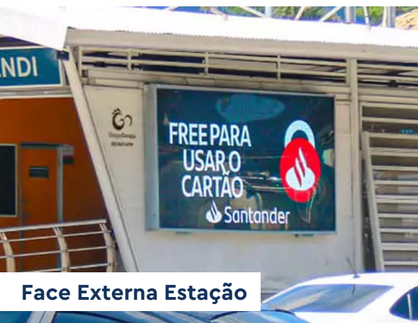
Face Externa Estação