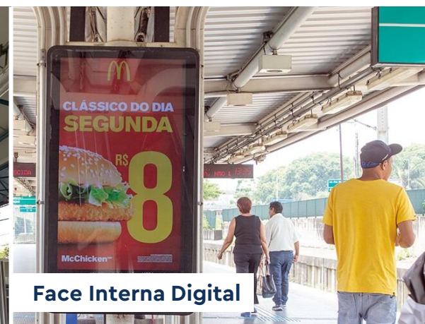
Face Interna Digital