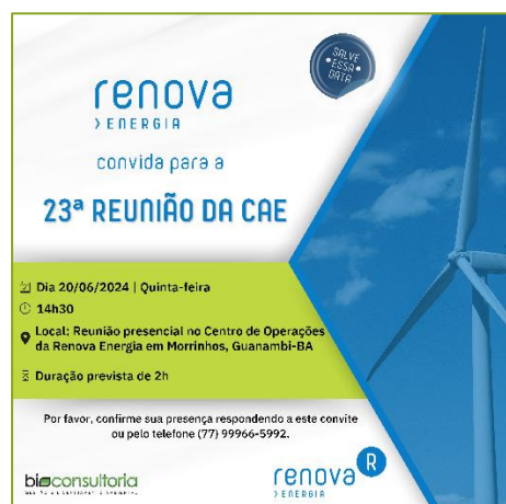
Figura 02: Card convite da 23ª Reunião da CAE. Aplicação.

Na esfera da área de Meio Ambiente, foram realizadas atividades voltadas para a Educação Ambiental e Social nas Áreas de Influência do projeto em operação do Complexo Eólico "Alto Sertão III" no estado da Bahia.