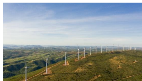
Imagem 2 Complexo Alto Sertão III - Fase A

O Alto Sertão III – Fase A possui 26 parques eólicos, com capacidade instalada de 432,6 MW – 155 Turbinas GE, e entrou em operação comercial em dezembro de 2022. A energia é comercializada nos mercados livre e regulado, 53,3% e 46,7%, respectivamente.