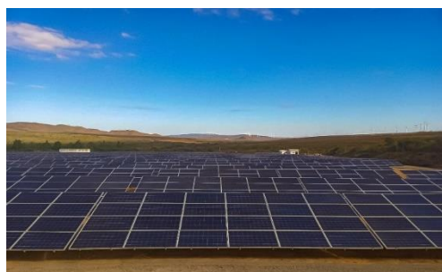
Imagem 3 Complexo Solar Caetité

O Complexo Solar Caetité, localizado no sudoeste da Bahia, tem capacidade instalada de 4,8MWp, composto por 19.200 módulos/placas de 245W cada e 4 inversores.