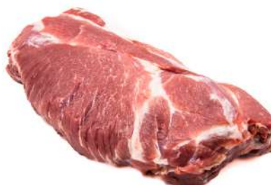
COPA LOMBO C 10005