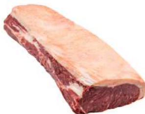
CHORIZO R 8201