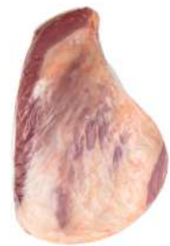
MAMINHA DA ALCATRA R 4008