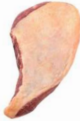
MAMINHA DA ALCATRA R 8003