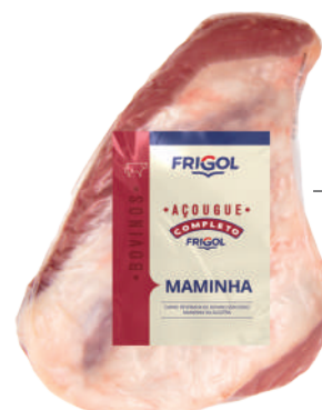
MAMINHA 8757 Embalado à Vacuo