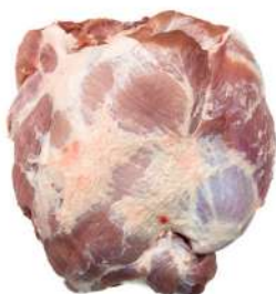
PERNIL C (SEM PELE E SEM OSSO) 10163