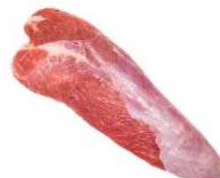
PEIXINHO R 8264