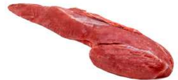
FILÉ MIGNON SEM CORDÃO R 8754