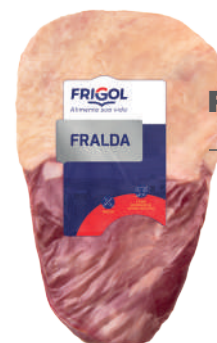
FRALDINHA R 4011