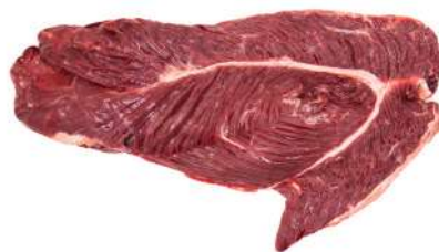
CARNE INDUSTRIAL C LOMBINHO 4260