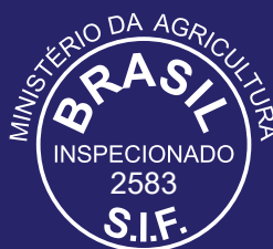
ÁGUA AZUL DO NORTE/ PA Bovinos