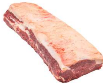
CONTRA FILÉ R 4002