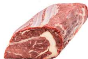
ENTRECÔTE R 8210