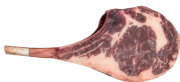
PRIME RIBS C (FILÉ DE COSTELA COM OSSO) 8218