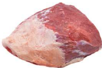
COXÃO MOLE R 4004