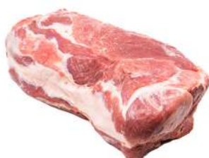
SOBREPALETA C (COM OSSO) 100003