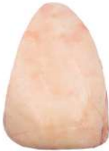
PICANHA R 8002