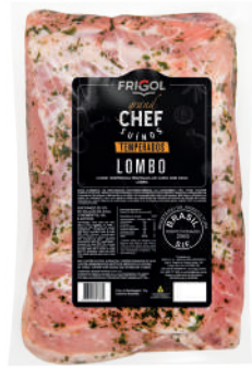
LOMBO R 9500

Uma linha versátil de cortes suínos, ideal para todas ocasiões. Cortes práticos, já temperados e prontos para assar!