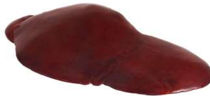
FÍGADO C 4077