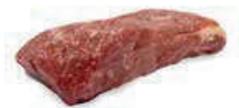
BOMBOM DA ALCATRA R 8205