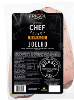
JOELHO C 9508