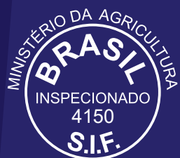
SÃO FÉLIX DO XINGÚ/ PA Bovinos