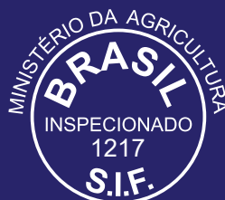
LENÇÓIS PAULISTA/ SP Suínos