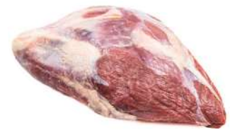
PALETA SEM MÚSCULO R 8753