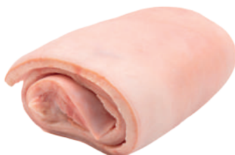
TOUCINHO LOMBAR C (COM PELE) 100004