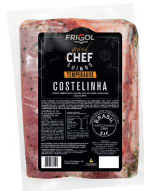
COSTELINHA R 9504