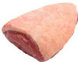
PICANHA R 8755