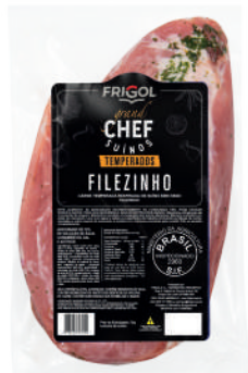
FILEZINHO R 9502