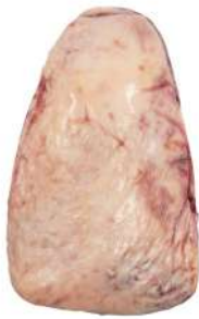
PICANHA R 4001

Cortes padronizados e embalados a vácuo, ideais para todas as refeições.