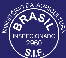
LENÇÓIS PAULISTA/ SP Bovinos