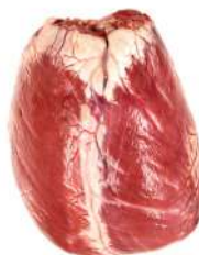
CORAÇÃO C 4104