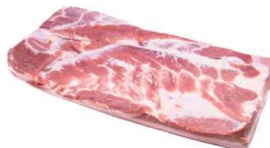
BARRIGA C 100000