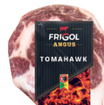
TOMAHAWK C 8233