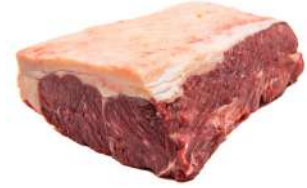
CONTRAFILÉ PORCIONADO R 8001