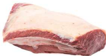
COXÃO DURO R 4005