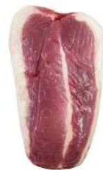
PEITO SEM OSSO 8024