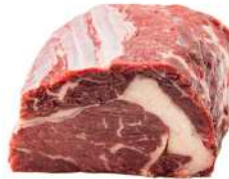
ENTRECÔTE R 8010