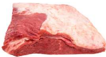
CAPA DE FILÉ R 4034