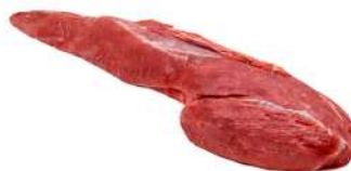
FILÉ MIGNON R 8200