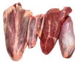
MÚSCULO DT R 8781