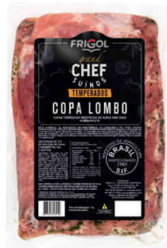
COPA LOMBO R 9503