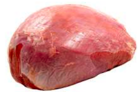
PATINHO R 4006