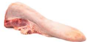
LÍNGUA C 4079