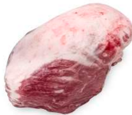
CUPIM R 4046