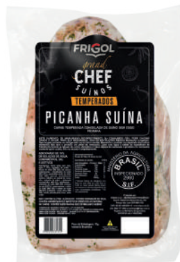
PICANHA R 9507