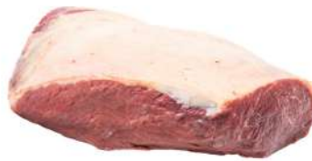
COXÃO DURO R 8751