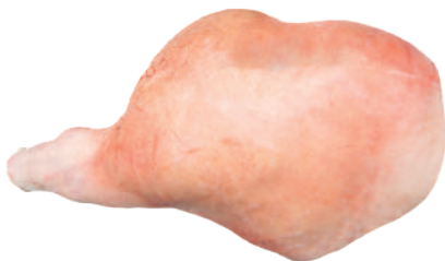
PERNIL C (COM COURO E OSSO) 10031