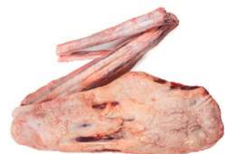
RABO C 4086