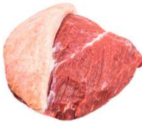
CORAÇÃO DA ALCATRA R 8756