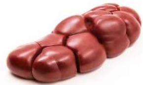
RIM C 4021