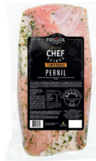
PERNIL R 9501