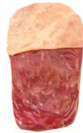
FRALDINHA R 8012