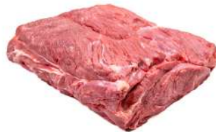
ACÉM R 8752