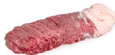
FRALDINHA R 8212