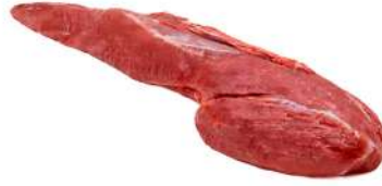
FILÉ MIGNON EXTRA LIMPO R 8000