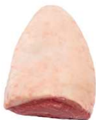
PICANHA R 8202

O melhor da Carne Bovina Angus. São cortes para momentos especiais, provenientes de um gado precoce, garantindo maciez e sabor inconfundíveis. Toda a linha é certificada pela Associação Brasileira de Angus, assegurando o melhor acabamento de gordura, marmoreio, sabor, suculência e maciez.