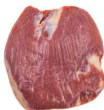
BIFE DO VAZIO R 8290