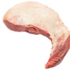
ALCATRA COM MAMINHA R 4003