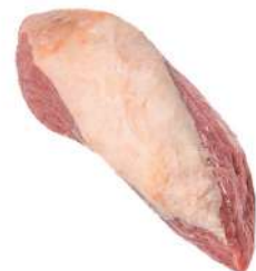
LAGARTO R 4055