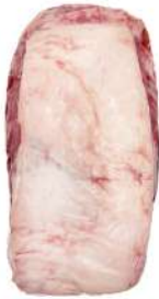
BABY BEEF R 8006