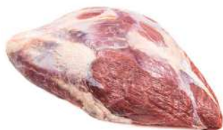
CORAÇÃO DA PALETA R 8220