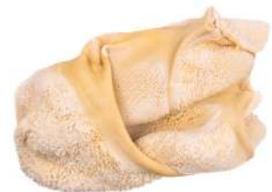
RÚMEN C 4090