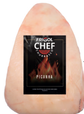
PICANHA R 8002