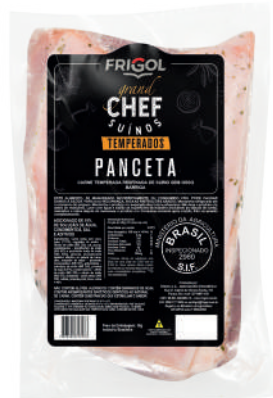
PANCETA R 9505