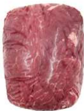
ROLHA DA ALCATRA 8016