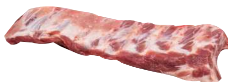
COSTELINHA CHURRASQUEIRO C 10228