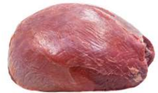
PATINHO R 8759