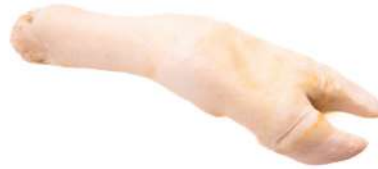
MOCOTÓ C 4007