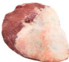
PEITO R 8230