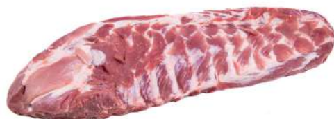
COSTELINHA C 10240