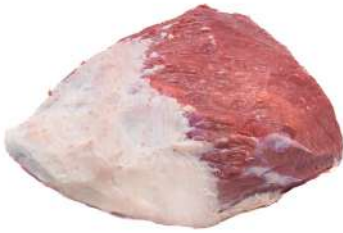
COXÃO MOLE R 8750

Cortes padronizados e embalados a vácuo, ideais para todas as refeições.