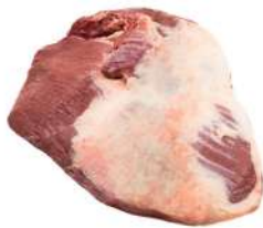
PEITO R 8763