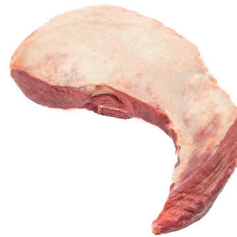
ALCATRA COM MAMINHA ■ 4003