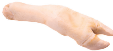
MOCOTÓ ■ 4007