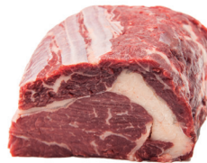
ENTRECÔTE ■ 8010