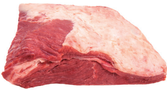
CAPA DE FILÉ ■ 4034