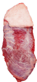
FRALDA ■ 8762