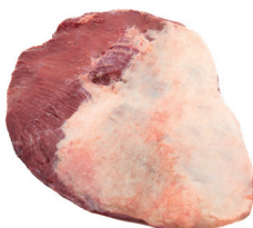
PEITO ■ 8230