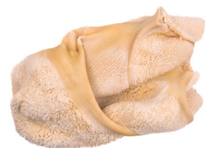
RÚMEN ■ 4090