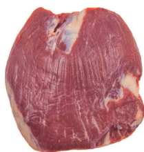
BIFE DO VAZIO ■ 8290