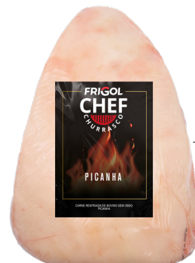
PICANHA ■ 8002