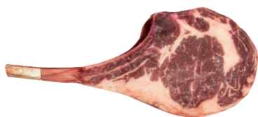
PRIME RIBS ■ (FILÉ DE COSTELA COM OSSO) 8218