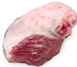
CUPIM ■ 4046