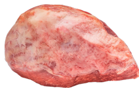
CUPIM ■ 8023