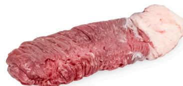
FRALDINHA ■ 8212