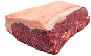
CONTRAFILÉ PORCIONADO ■ 8001