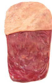
FRALDINHA ■ 8012