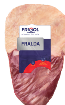
FRALDINHA ■ 4011