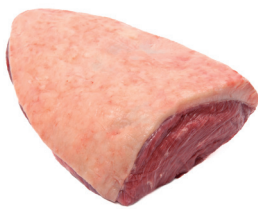
PICANHA ■ 8755