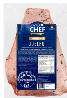
JOELHO ■ 9508