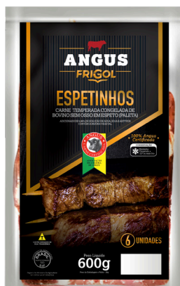
ESPETINHO ANGUS 600G ■ 5713