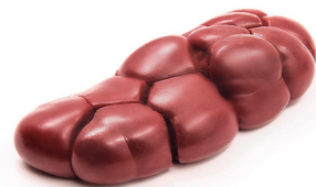
RIM ■ 4021