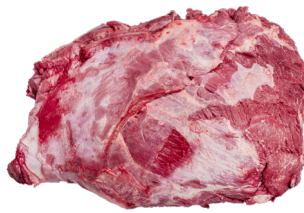
ACÉM ■ 8752