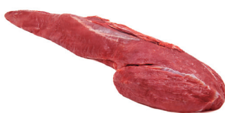
FILE MIGNON ■ 8200