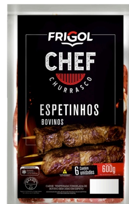
ESPETINHO BOVINO 600G ■ 5712