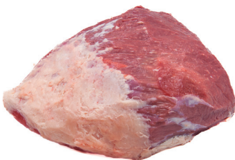
COXÃO MOLE ■ 4004