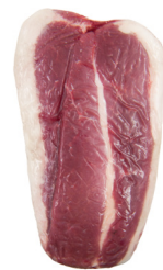
PEITO SEM OSSO ■ 8024