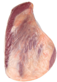
MAMINHA DA ALCATRA ■ 4008