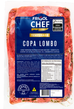
COPA LOMBO ■ 9503