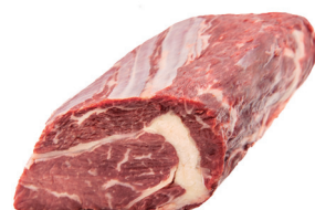
ENTRECÔTE ■ 8210