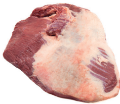
PEITO ■ 8763