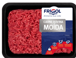
CARNE MOÍDA ■ 5721