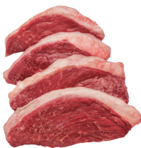
PICANHA FATIADA ■ 8033