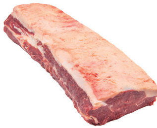
CONTRA FILÉ ESPECIAL SEM NOIX ■ 4162