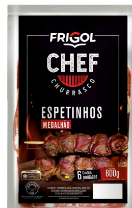
ESPETINHO MEDALHÃO 600G ■ 5717