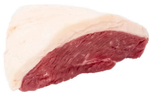
PICANHA ■ 8202

O melhor da Carne Bovina Angus. São cortes para momentos especiais, provenientes de um gado precoce, garantindo maciez e sabor inconfundíveis. Toda a linha é certificada pela Associação Brasileira de Angus, assegurando o melhor acabamento de gordura, marmoreio, sabor, suculência e maciez.