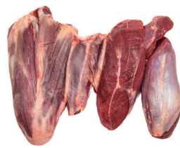
MÚSCULO DT ■ 8781