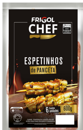
ESPETINHO PANCETA 600G ■ 5711