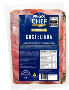
COSTELINHA ■ 9504