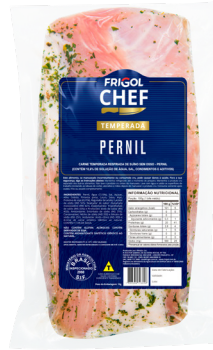
PERNIL ■ 9501