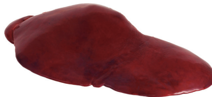
FÍGADO ■ 4077