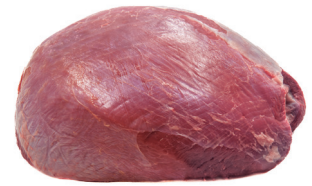
PATINHO ■ 8759