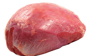
PATINHO ■ 4006