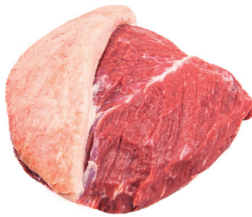
CORAÇÃO DA ALCATRA ■ 8756