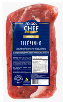
FILEZINHO ■ 9502