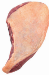
MAMINHA DA ALCATRA ■ 8003