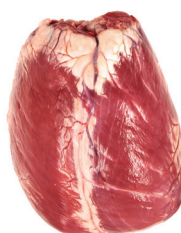
CORAÇÃO ■ 4104