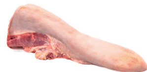
LÍNGUA ■ 4079