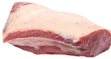
COXÃO DURO ■ 8751