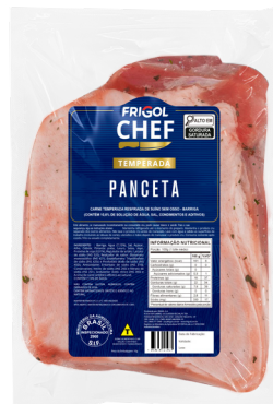
PANCETA ■ 9505