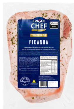
PICANHA ■ 9507