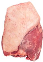
BABY BEEF ■ 8006