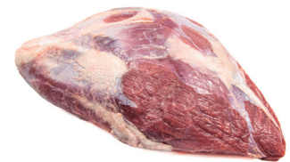
PALETA SEM MÚSCULO ■ 8753