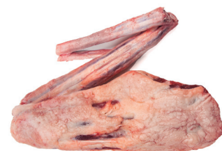
RABO ■ 4086