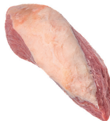
LAGARTO ■ 8760