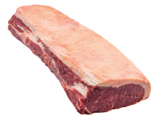
CONTRAFILÉ BARRA ■ 8770