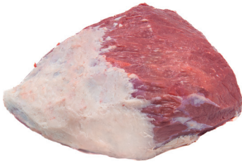
COXÃO MOLE ■ 8750

Cortes padronizados e embalados a vácuo, ideais para todas as refeições.