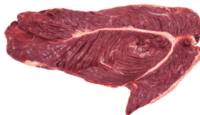
CARNE INDUSTRIAL LOMBINHO ■ 4260