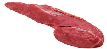
FILÉ MIGNON SEM CORDÃO ■ 8754