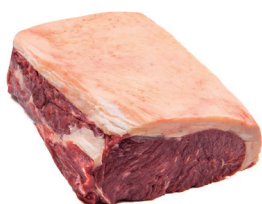
CHORIZO ■ 8201