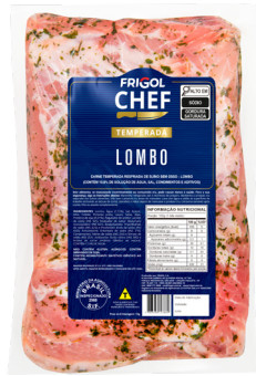
LOMBO ■ 9500

Uma linha versátil de cortes suínos, ideal para todas ocasiões. Cortes práticos, já temperados e prontos para assar!