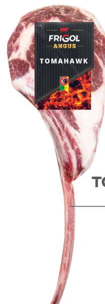
TOMAHAWK ■ 8233