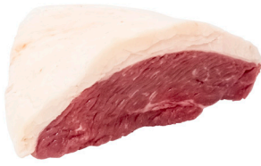
PICANHA ■ 4001

Cortes padronizados e embalados a vácuo, ideais para todas as refeições.