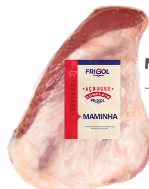
MAMINHA ■ 8757