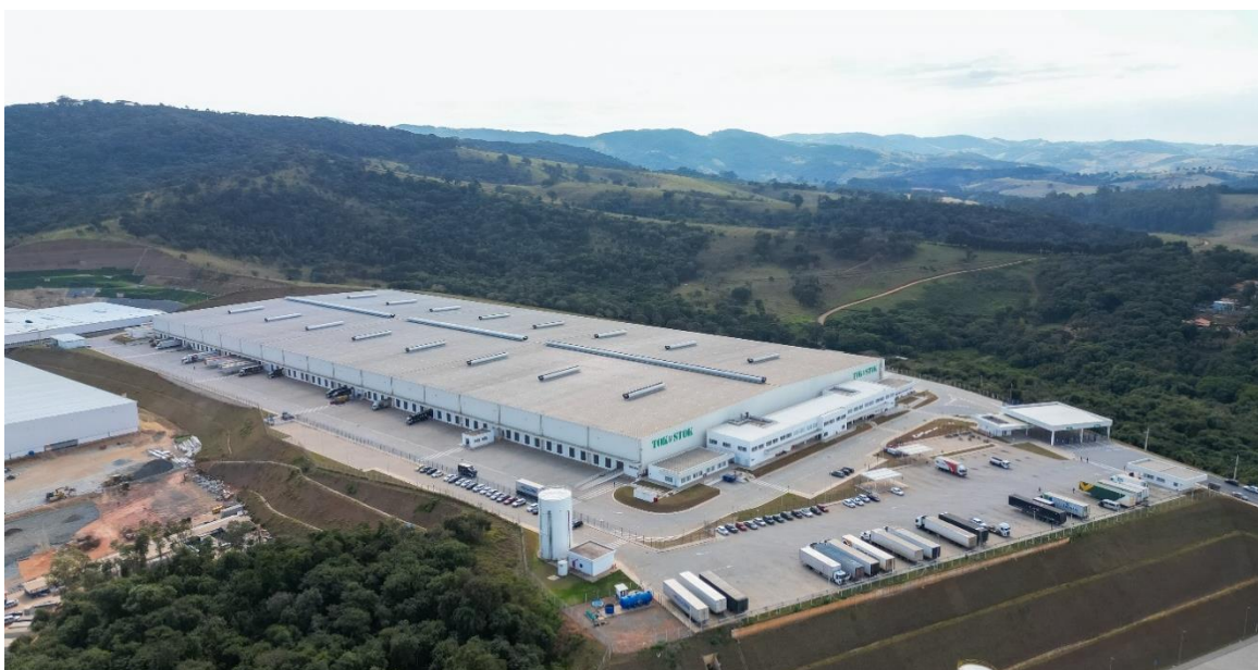
Extrema Business Park, Bloco I – Extrema, MG

O Aditivo formaliza novas locações de dois módulos (15.462,14 m 2 ), e a sua consequente devolução por parte da Tok&Stok, além de estabelecer as condições para a devolução de outros quatro módulos (31.410,10 m 2 ) até 31 de dezembro de 2025, ou em data anterior, caso sejam assinados novos contratos com terceiros até esta data. A área remanescente (20.067,64 m 2 ), correspondente a dois módulos, seguirá ocupada pela Tok&Stok, conforme os termos do contrato vigente, com vencimento em abril de 2030. Maiores detalhes acerca do Aditivo estão descritos na seção “Aditivo Contratual Tok&Stok” abaixo.