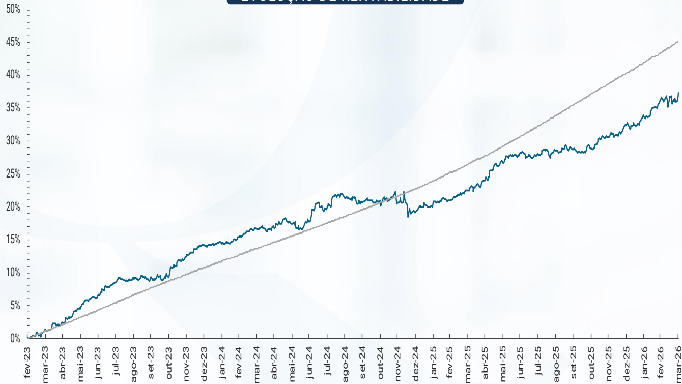
EVOLUÇÃO DE RENTABILIDADE