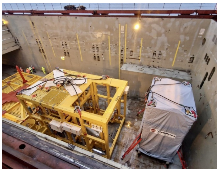
Equipamentos embarcados em trajetória para Atlanta