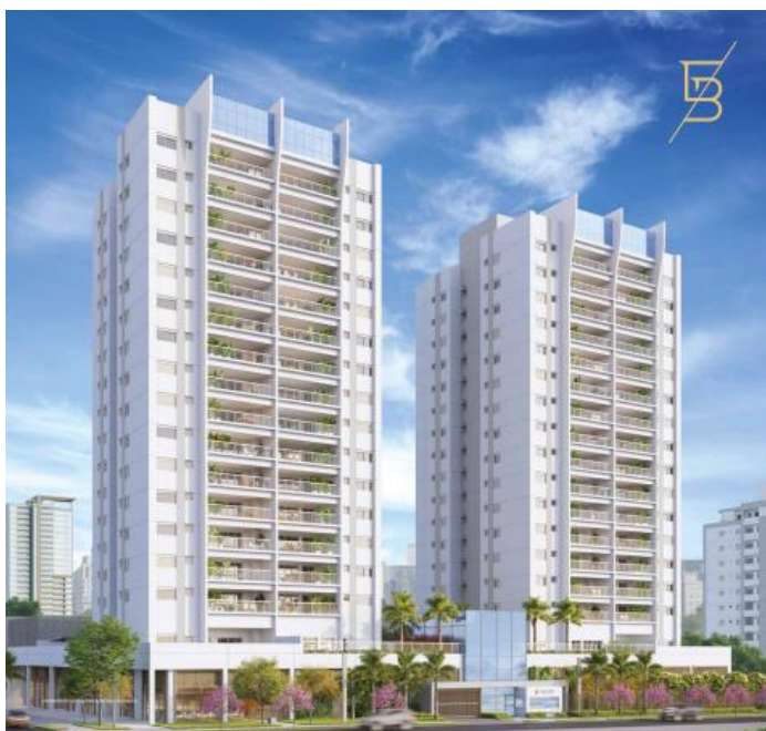
- East Blue da EZTEC

E para o bem-estar e lazer dos condôminos, o local ainda possui salão de festas, salão de jogos, lounge festas, piscina adulto, piscina infantil, pool house , playground , brinquedoteca, churrasqueira, quadra recreativa, academia para aeróbico e musculação e bicicletário, proporcionando uma experiência única de moradia e todos os serviços para maior praticidade e conforto.