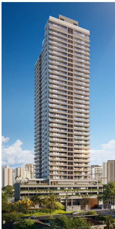
Perspectiva ilustrada da Fachada