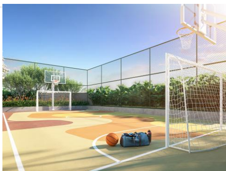
Perspectiva ilustrada da Quadra de Esportes

Com 47 anos de história , a Eztec é uma das empresas com maior lucratividade entre as empresas de capital aberto do setor de incorporação e construção no Brasil. Com seu modelo de negócio totalmente integrado, a Companhia já lançou 197 empreendimentos , totalizando mais de 5,8 milhões de metros quadrados de área construída e em construção e 48.006 unidades .