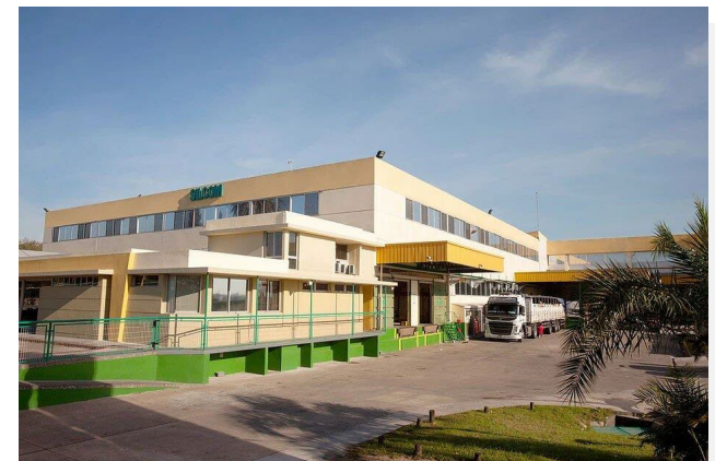
Localização: Montevideo, Uruguai Área: 5.000m 2