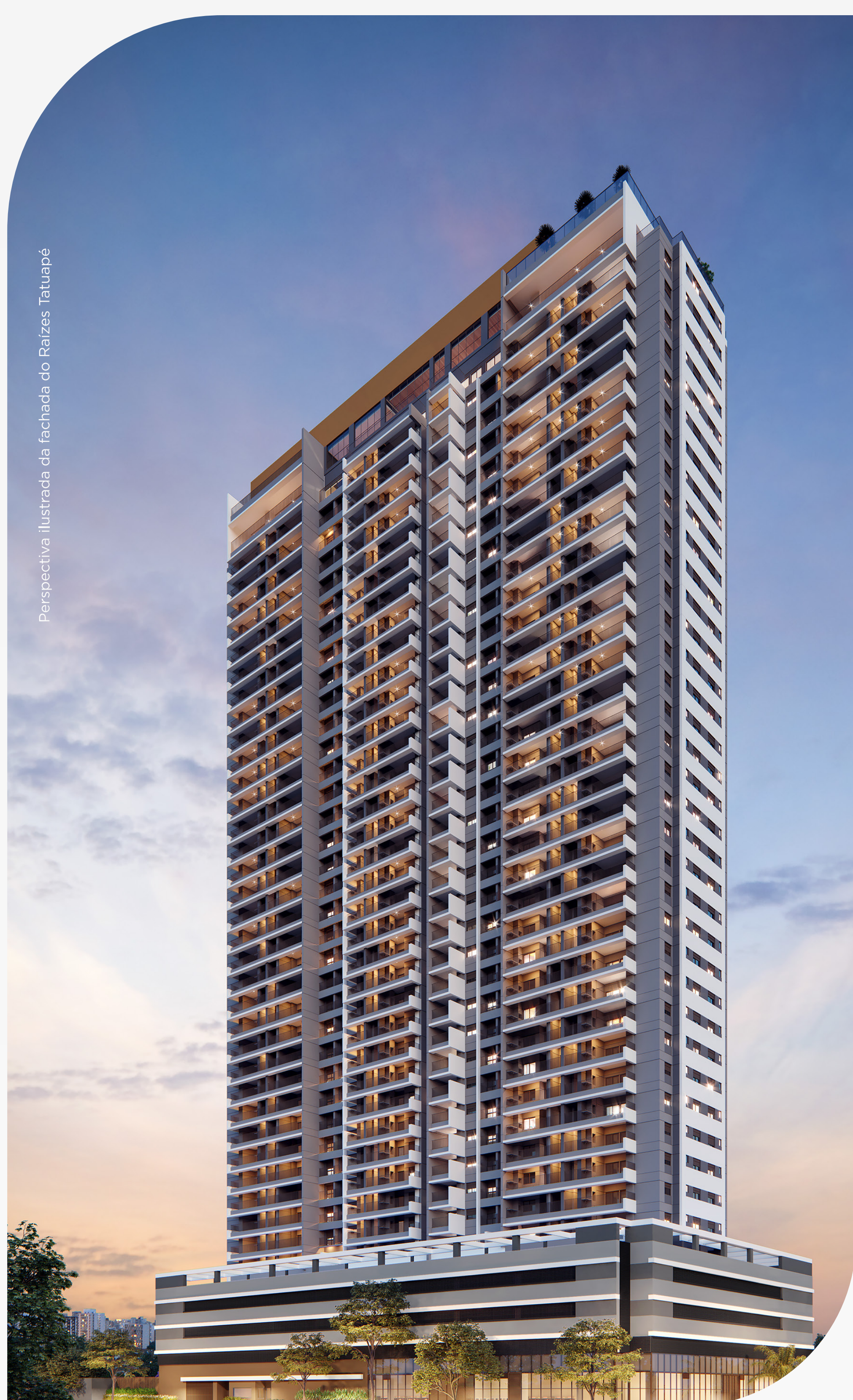
Perspectiva ilustrada da fachada do Raízes Tatuapé