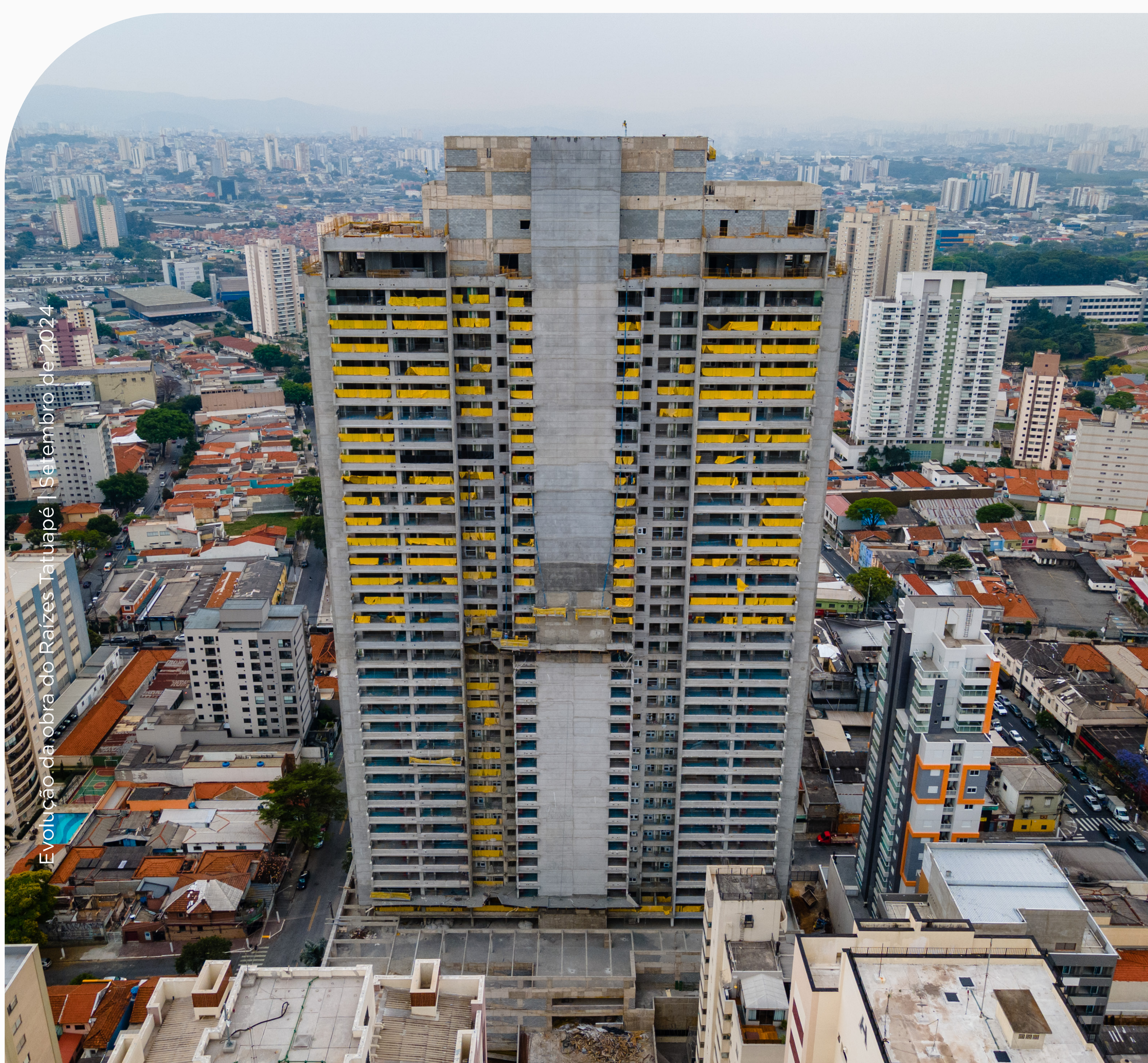
Evolução da obra do Raízes Tatuapé | Setembro de 2024