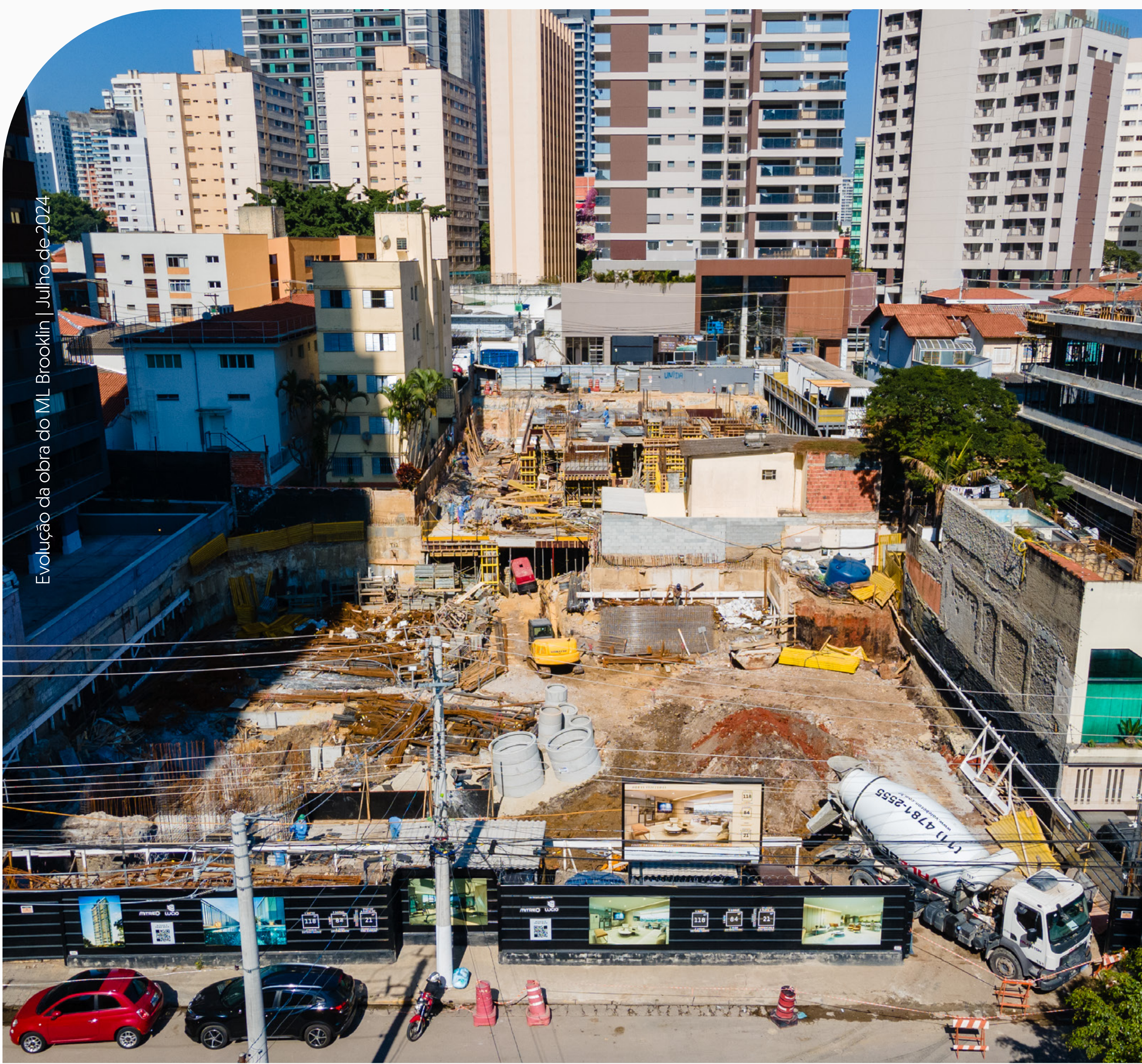
Evolução da obra do ML Brooklin | Julho de 2024