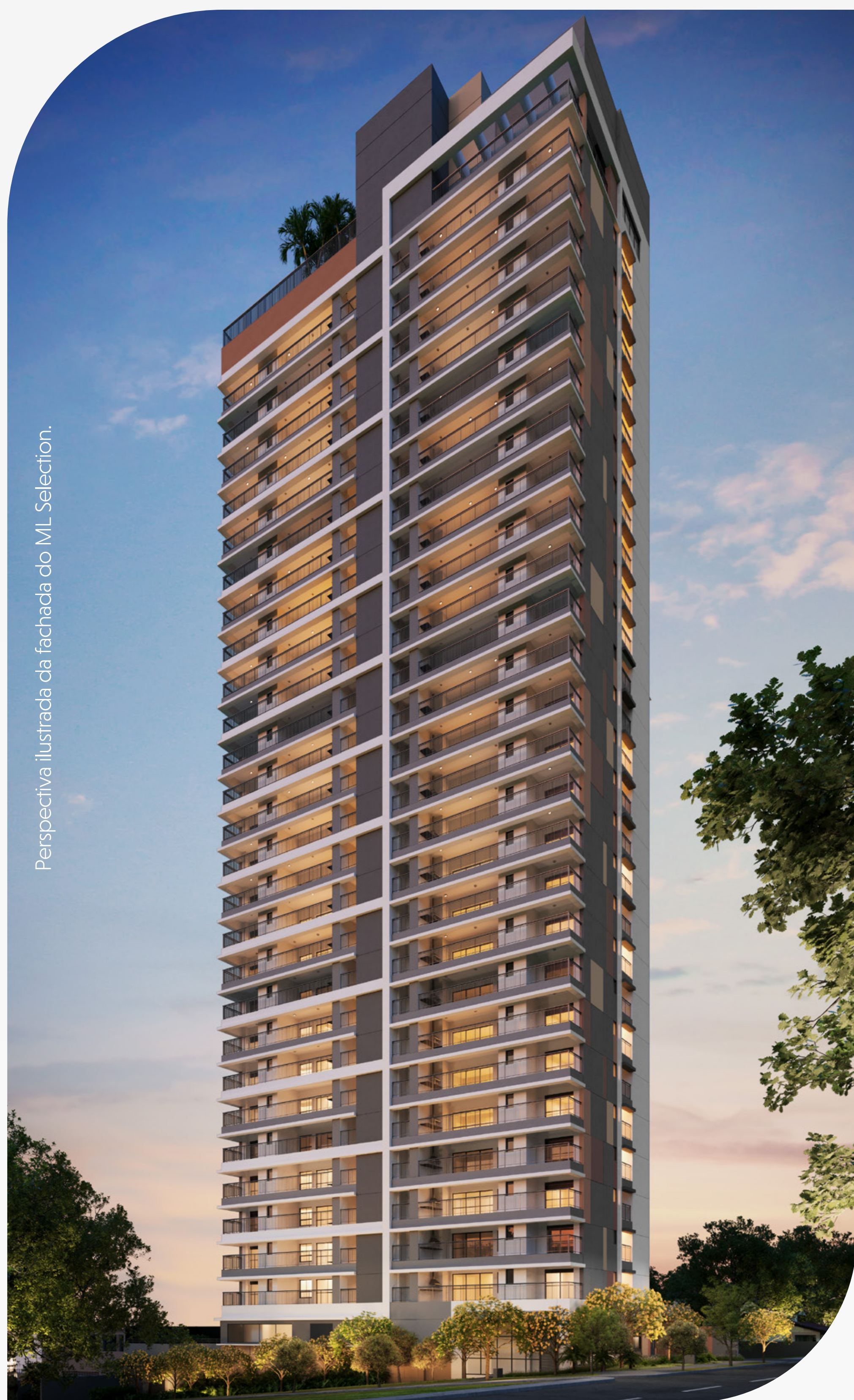
Perspectiva ilustrada da fachada do ML Selection.