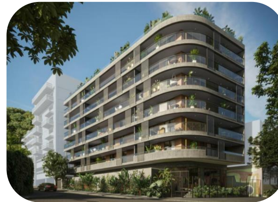
Arte JB – Jardim Botânico, Rio de Janeiro