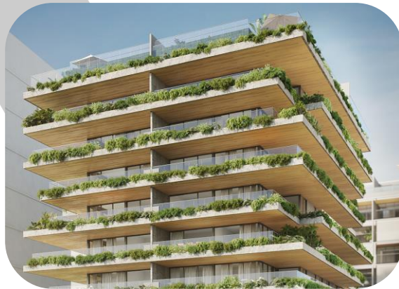
Canto – Arpoador, Rio de Janeiro