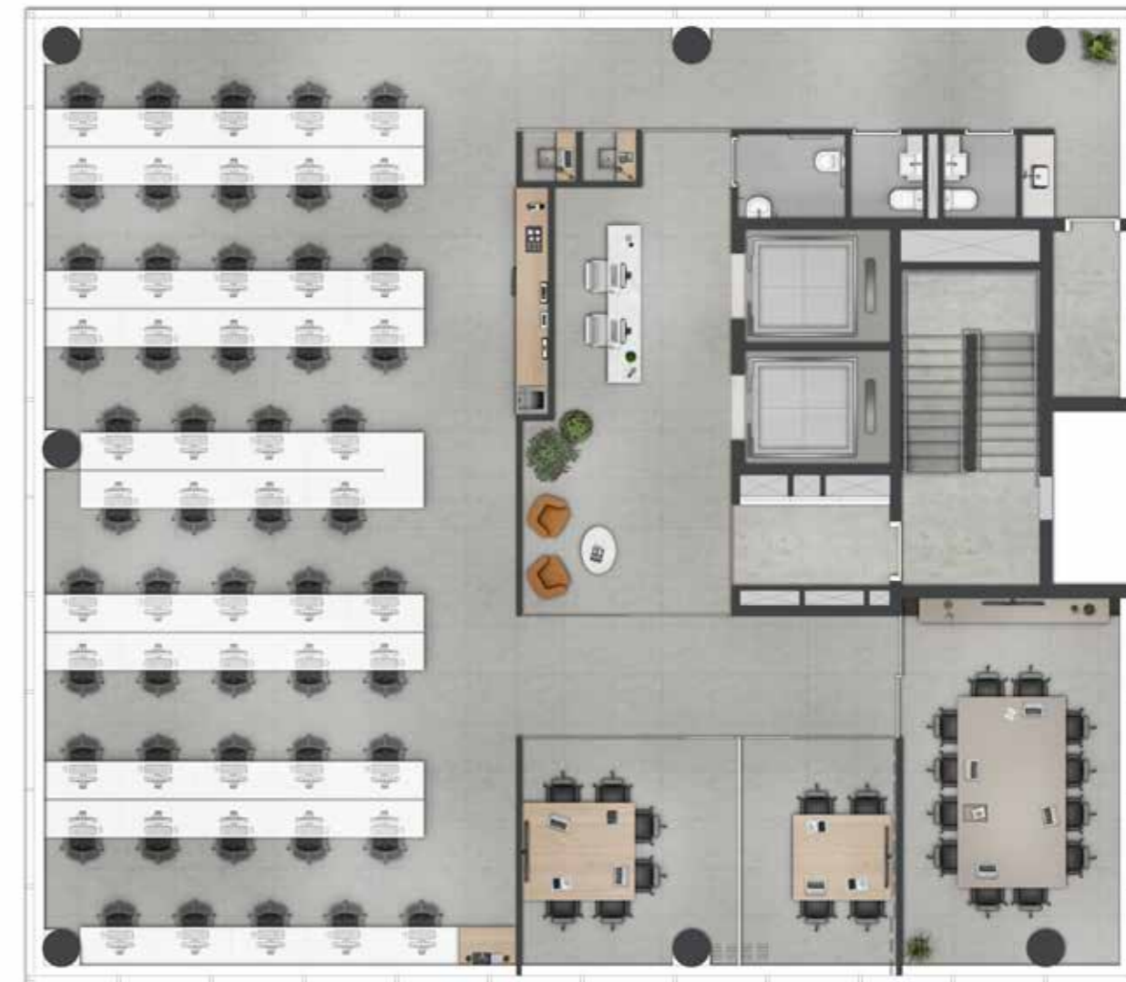
IMAGEM PRELIMINAR PROJETO EM DESENVOLVIMENTO

PLANTA ILUSTRADA DO PAVIMENTO-TIPO - 384 m 2 Projeto em desenvolvimento. As imagens são meramente ilustrativas e poderão sofrer alterações. As unidades serão entregues conforme Memorial Descritivo. As especificações do ativo serão aquelas presentes no Memorial Descritivo anexo ao Contrato de Compra e Venda.