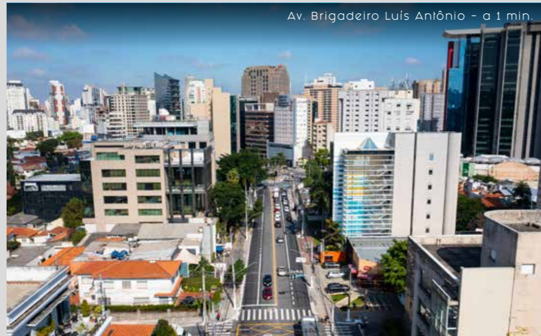
Av. Brigadeiro Luís Antônio - a 1 min.