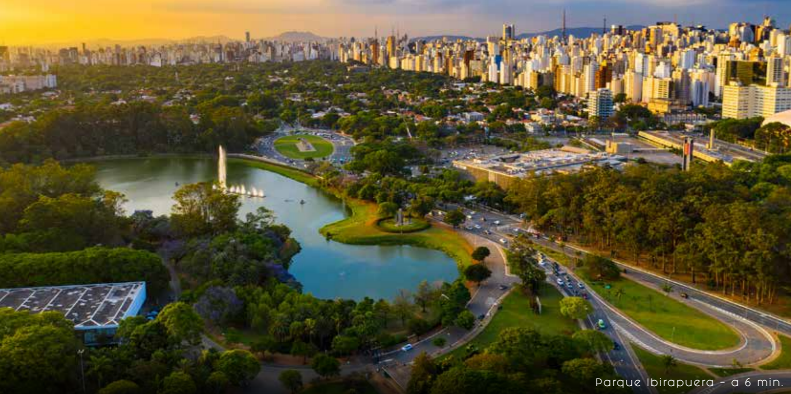
Parque Ibirapuera - a 6 min.