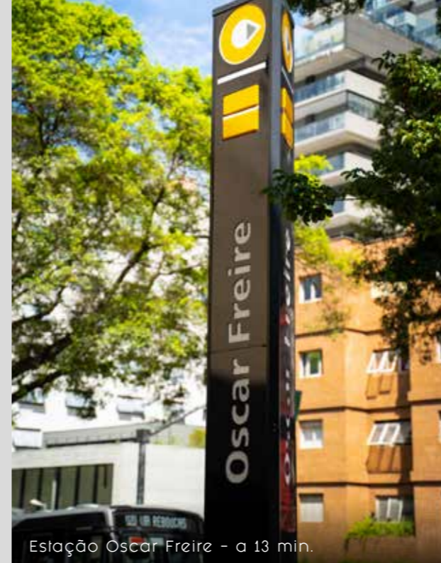
Estação Oscar Freire - a 13 min.