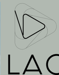
Ibirapuera/ Itaim Bibi Av. Brigadeiro Luís Antônio, 4979