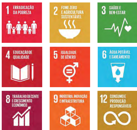
Objetivos de Desenvolvimento Sustentável da ONU (ODS) prioritários

anos, considera 9 áreas que se aplicam às nossas operações e estão alinhadas com os ODSs da ONU. Essa estratégia confirma nosso apoio aos processos de sustentabilidade globais e locais.