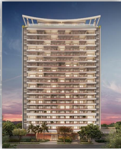
*Fachada em 3D do The Collection Moema.