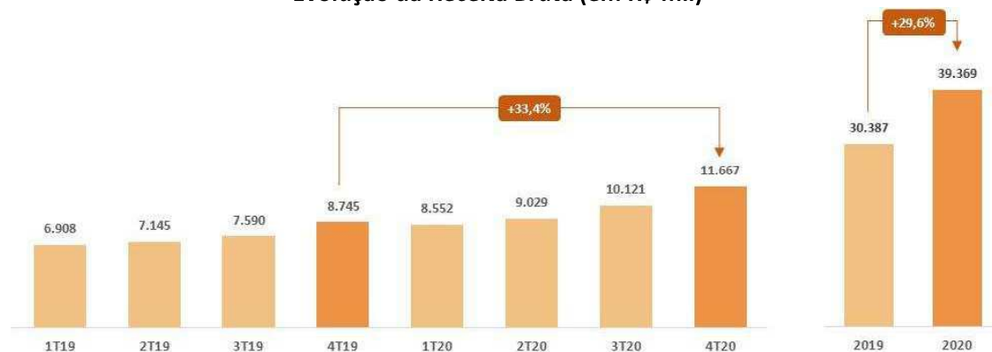
Evolução da Receita Bruta (em R$ mil)

As vendas ‘mesmas lojas’ tiveram uma evolução de 19,6% no trimestre e 14,1% no ano, demonstrando a forte aderência do seu modelo de negócio ao mercado e a rápida capacidade de adaptação diante dos diferentes cenários.