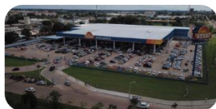
Porto Velho (RO)

Durante o 1T22, o Assaí inaugurou 4 novas lojas, sendo duas na região Norte e duas na região Nordeste, fortalecendo a presença da Companhia em regiões com alto potencial de crescimento. No acumulado dos últimos 12 meses, foram entregues 32 lojas, o que representa um crescimento da área de vendas de 22% e reflete a alta capacidade de execução da Companhia. Atualmente, 216 lojas estão em operação, totalizando uma área de vendas de 986 mil m 2 .