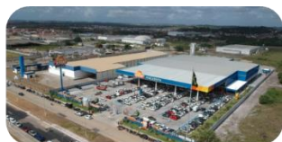
Nossa Senhora do Socorro (SE)