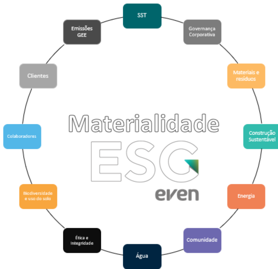
Figura 1 – Materialidade Even 2021/2023