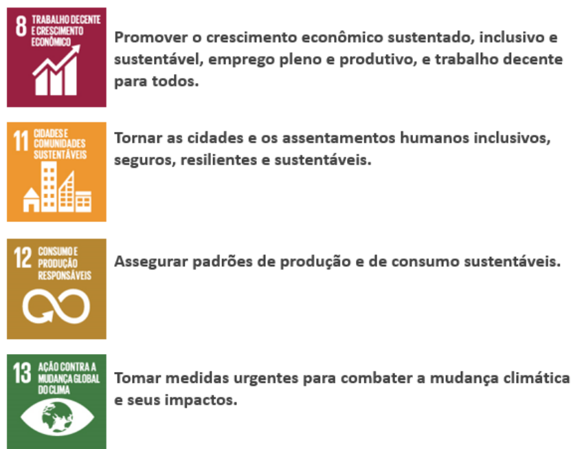
Figura 4 - ODS's priorizados pela Even.