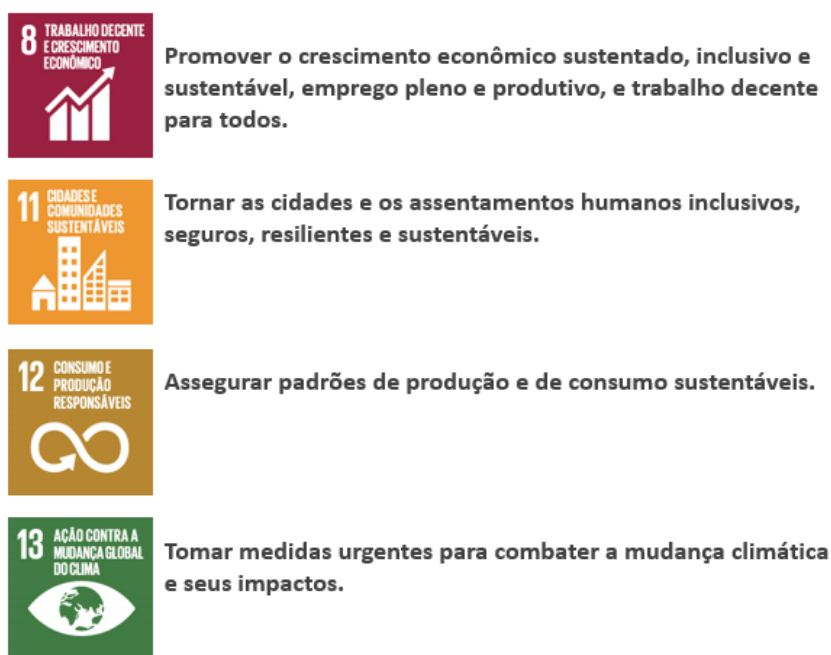
Figura 4 - ODS's priorizados pela Even.

Na figura 4 a seguir estão destacados os ODS's priorizados pela Even para que sejam estabelecidas práticas que demonstrem o nosso compromisso com o desenvolvimento econômico sustentável: