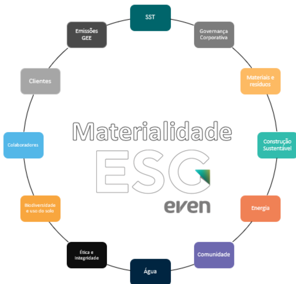
Figura 1 – Materialidade Even 2021/2023

Buscamos atualizar nossa Materialidade para definir quais são os temas prioritários para atuação do Grupo Even no que tange ao cumprimento da agenda ASG. A materialidade do Grupo Even compõe os temas relacionados na Figura 1.