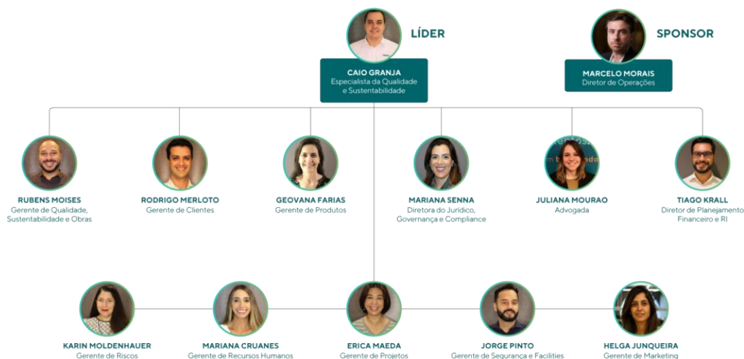
Figura 2 - Organograma do Comitê ASG 2021/2022.

6.3. Mudanças Climáticas: As mudanças climáticas e o risco do potencial aumento da temperatura do planeta devem ser preocupações constantes da Agenda ASG do Grupo Even. Desta forma, buscaremos a criação de mecanismos para adaptação às mudanças climáticas e análise de riscos associados a questões ambientais (crise hídrica – enchentes, alagamentos, deslizamentos de terra, entre outras) e sobre questões associadas a fornecimento de energia elétrica (falta de energia, oscilação de preços, mudança de matriz energética para energias renováveis, entre outras).